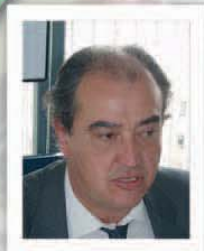
Alejandro Lazcano Arranz

SUBDIRECTOR GENERAL DE PLANIFICACIÓN Y COORDINACIÓN INFORMÁTICAS MIN. TRABAJO Y AS. SOCIALES